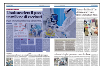
Peso: 1-2%, 2-51%

da le possibili restrizioni in arrivo in caso di passaggio in zona gialla, l'isola questa volta sembra destinata a cavarcela per un pelo. È stato confermato il superamento della soglia di saturazione del 10 per cento dei posti letto in terapia intensiva occupati da pazienti Covid-19, che attualmente si attesta al 13 per cento, mentre sono vicinissimi al limite del 15 per cento i posti letto in area medica. Il responso ufficiale arriverà oggi pomeriggio, dopo il consueto monitoraggio settimanale effettuato dall'Istituto superiore di sanità e dal ministero della Salute. Se dovessero essere confermati i dati raccolti negli ultimi giorni, cosa che sembra sempre più probabile, la Sardegna non imitereb-