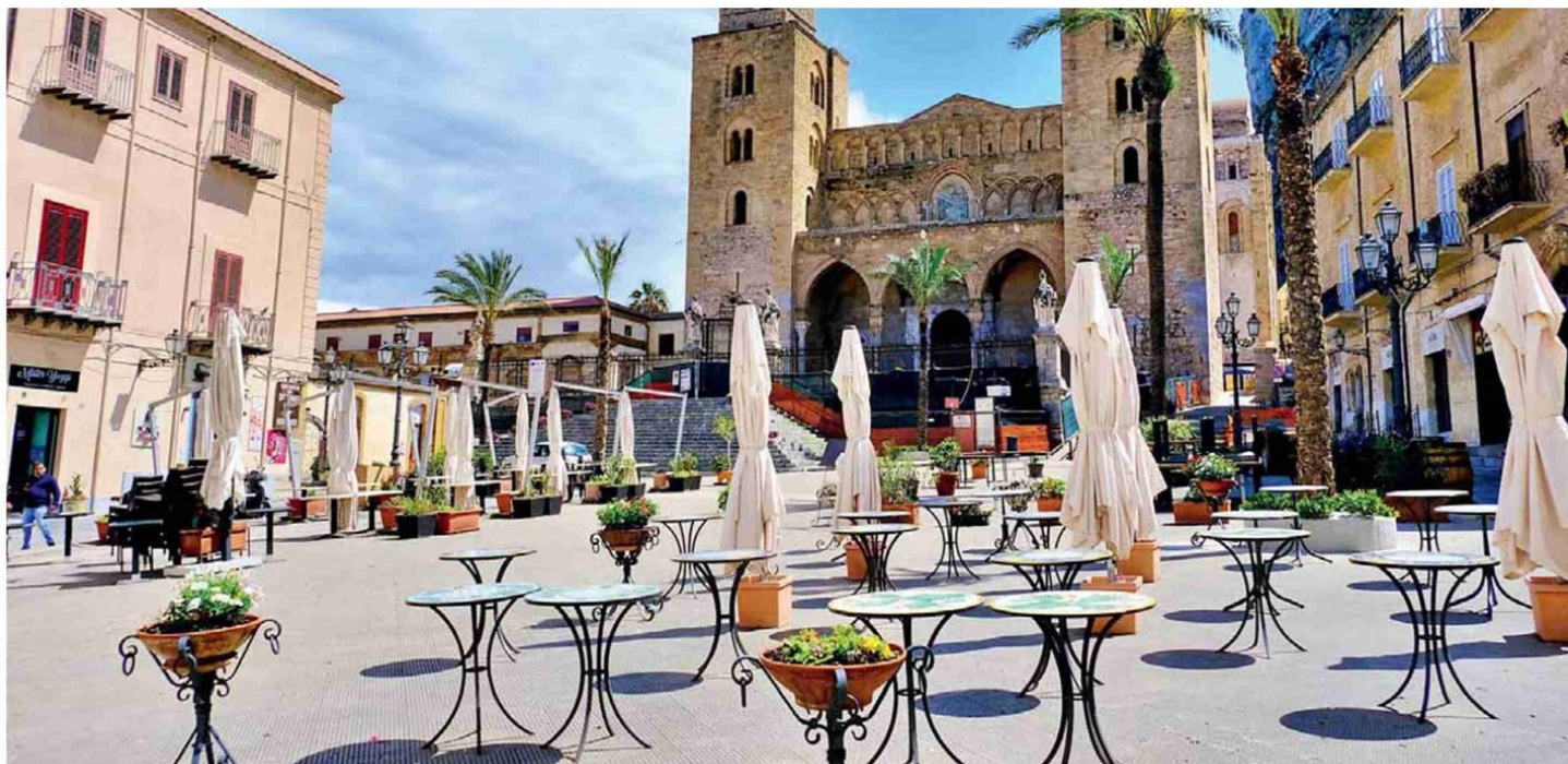
• Uno scorcio di una piazza di Cefalù in provincia di Palermo