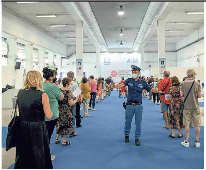
Mostra d'Oltremare In fila per vaccinarsi