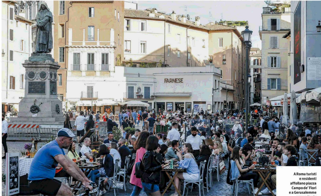
A Roma turisti e residenti affollano piazza Campo de' Fiori e a Gerusalemme un sanitario inocula ad una paziente una dose di siero contro il Covid-19