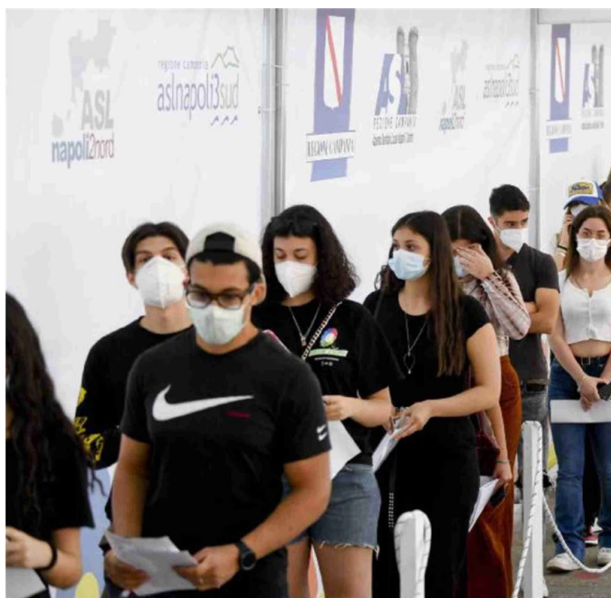
La campagna per i giovani Maturandi in coda all'hub di Capodichino, a Napoli