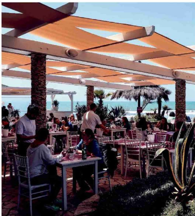
Ristoranti affollati sul lungomare di Ostia

50 invitati, responsabile del rispetto delle norme anti-virus alla ripresa oramai imminente di eventi e cerimonie. —