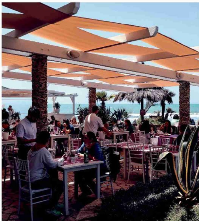
Ristoranti affollati sul lungomare di Ostia