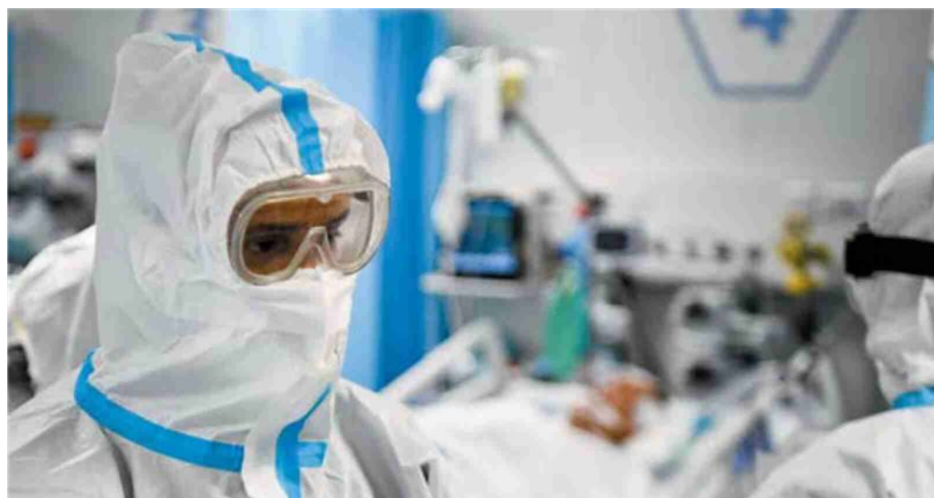
Un reparto di terapia intensiva