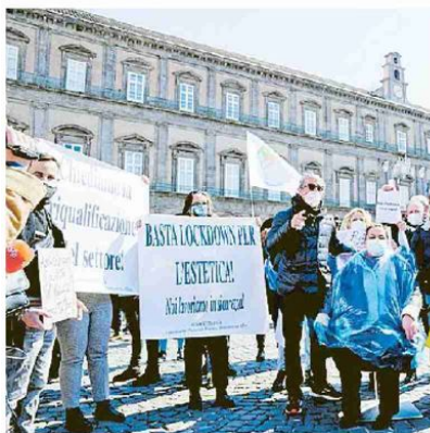
La protesta dei parrucchieri di Napoli