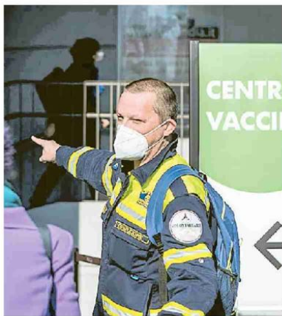
In fila per il vaccino alla Fiera di Milano

I dimessi o guariti nelle ultime ventiquattro ore, a fronte di un totale di 2.732.482 dall'inizio della pandemia