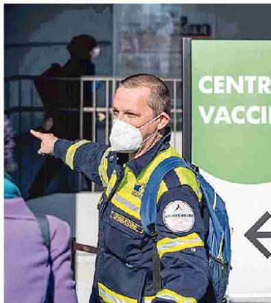
In fila per il vaccino alla Fiera di Milano

I dimessi o guariti nelle ultime ventiquattro ore, a fronte di un totale di 2.732.482 dall'inizio della pandemia