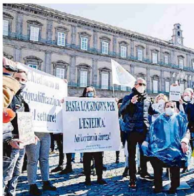
La protesta dei parrucchieri di Napoli