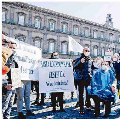
La protesta dei parrucchieri di Napoli