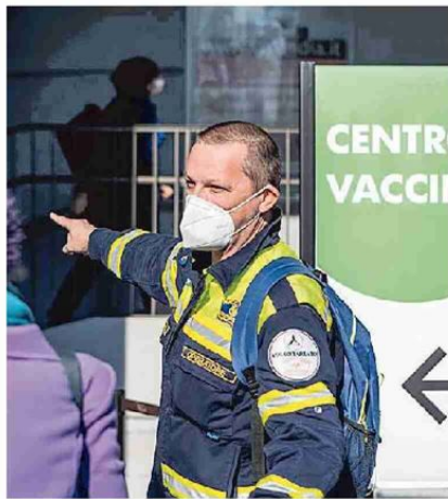
In fila per il vaccino alla Fiera di Milano

I dimessi o guariti nelle ultime ventiquattro ore, a fronte di un totale di 2.732.482 dall'inizio della pandemia