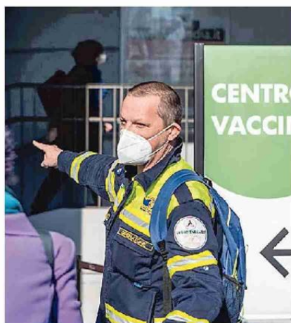
In fila per il vaccino alla Fiera di Milano

I dimessi o guariti nelle ultime ventiquattro ore, a fronte di un totale di 2.732.482 dall'inizio della pandemia