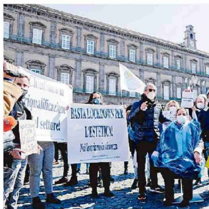
La protesta dei parrucchieri di Napoli