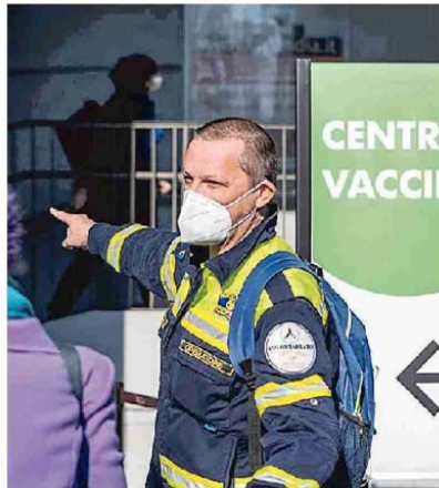
In fila per il vaccino alla Fiera di Milano

I dimessi o guariti nelle ultime ventiquattro ore, a fronte di un totale di 2.732.482 dall'inizio della pandemia