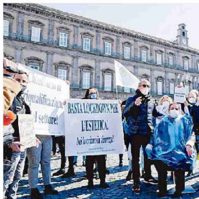
La protesta dei parrucchieri di Napoli