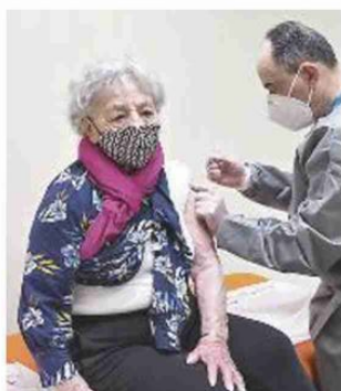
L'anziana simbolo degli over 80