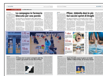
Peso: 1-18%, 5-59%, 4-23%