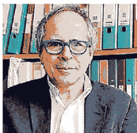
ANDREA CRISANTI DIRETTORE DEL DIPARTIMENTO DI MICROBIOLOGIA DELL'UNIVERSITÀ DI PADOVA

Per l'esperto, bisognerebbe invece prendere in esame «un parametro che tenga conto dell'incidenza del numero dei tamponi fatti e della popolazione». Troppo larghe, per il direttore di Microbiologia, anche le maglie della soglia dei 250 casi per 100mila abitanti introdotta nel nuovo. «Va uniformata la capacità di fare tamponi e rendere il passaggio automatico, e non facoltativo, al superamento della soglia», aggiunge Crisanti. Tracciamento e vaccini restano l'unica arma efficace. «Anche dopo che avremo raggiunto l'immunità», conclude Crisanti, «perché la maggior parte del mondo non è vaccinato e la copertura per noi è di circa un anno». —