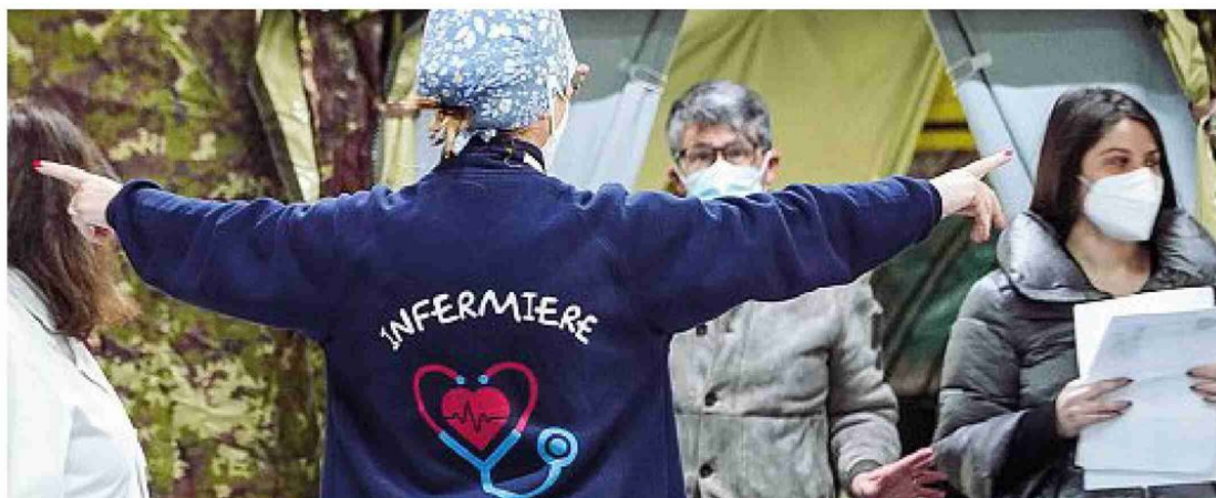
In Campania il polo vaccinale alla Caserma Ferrari Orsi di Caserta, sede della Brigata Bersaglieri Garibaldi