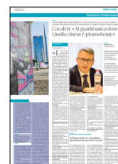
Peso: 2-41%, 3-14%