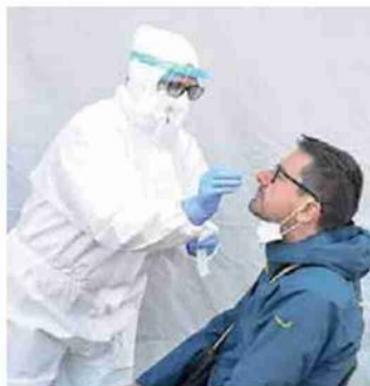
• Tamponi drive-in in Fiera a Bolzano

La lotta alla pandemia. Adesione altissima a scuola, dosi esaurite Alto Adige al top in Italia per numero di over 80 già vaccinati Fine della "via autonoma". I giudici: competenza statale > Servizi a pag. 16,17,18