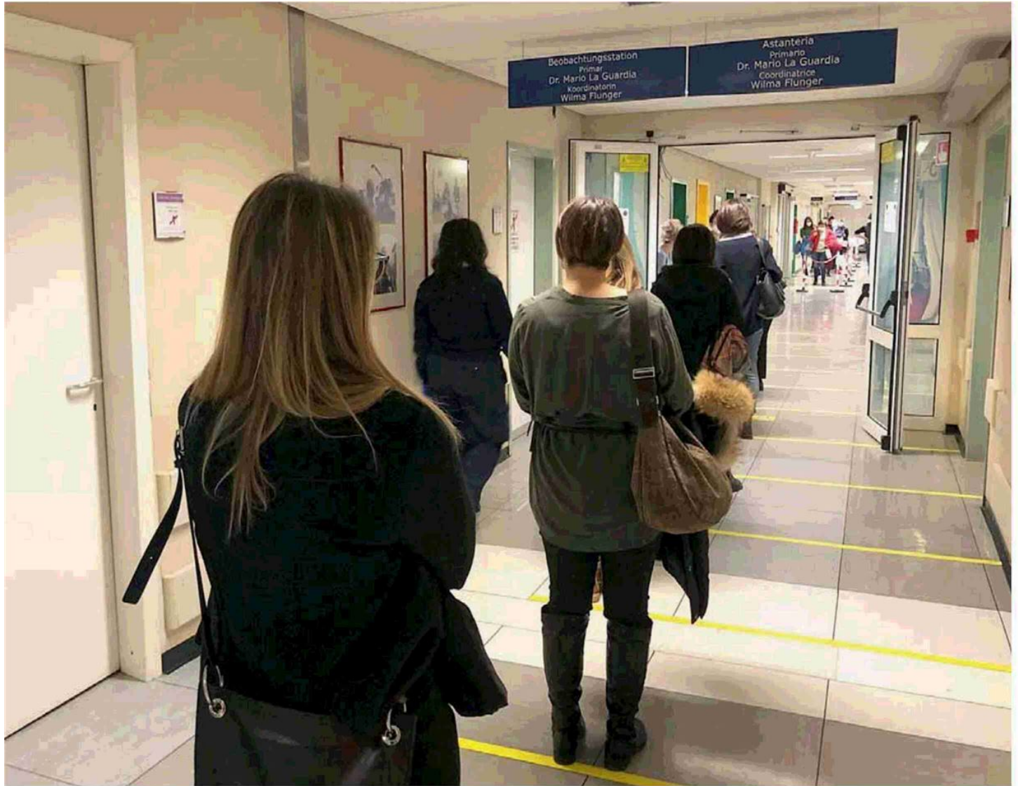
Scuola:esaurite tutte le prenotazioni di lunedì e martedì prossimo, restano circa 500 posti per mercoledì. In alto personale scolastico al San Maurizio