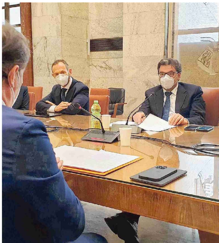
Il ministro dello Sviluppo Giancarlo Giorgetti durante l'incontro con Federfarma