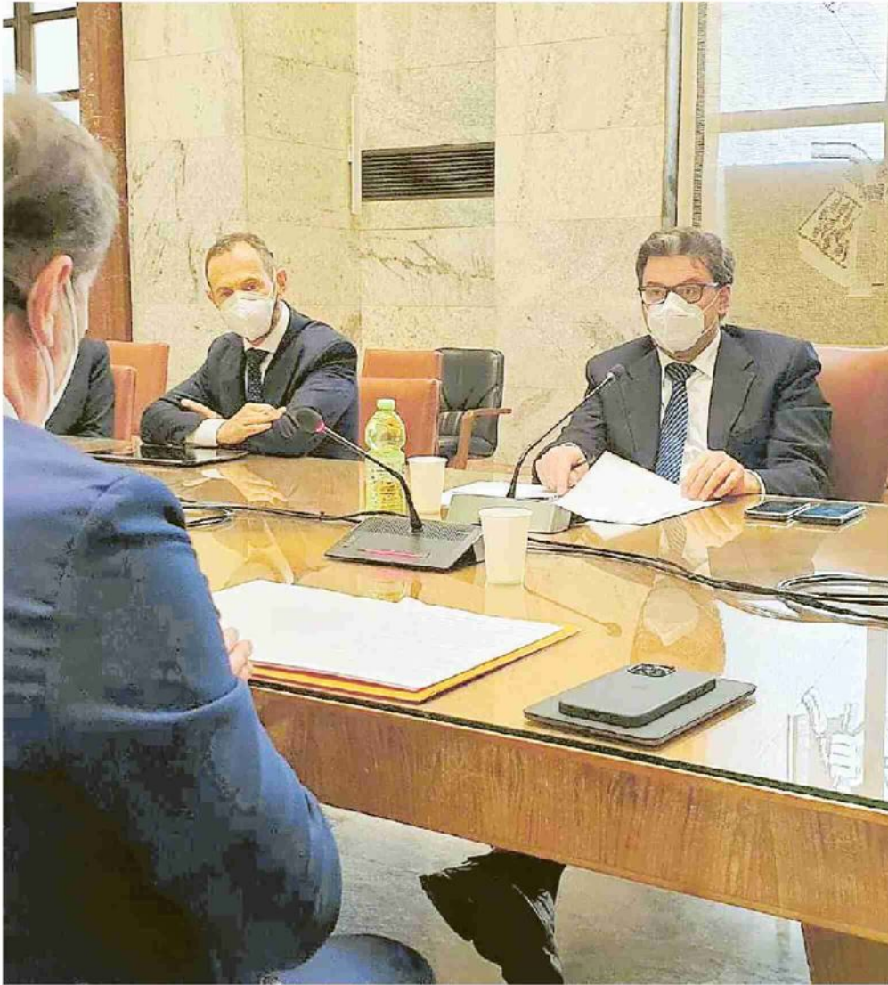
Il ministro dello Sviluppo Giancarlo Giorgetti durante l'incontro con Federfarma