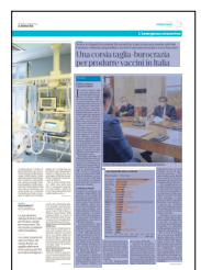
Peso: 1-2%, 3-57%

estate. In Italia anche Catalent vicino Roma produce già per AstraZeneca e Janssen, senza contare l'Irbm di Pomezia che sta metten-