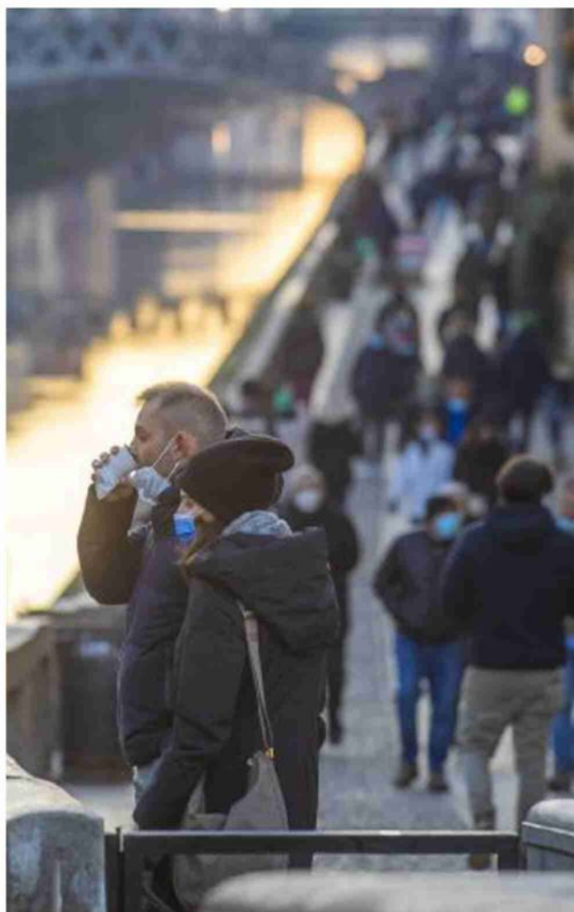
Lo struscio lungo i Navigli a Milano

Accordo politico sul documento per viaggiare Michel dice no alle posizioni unilaterali