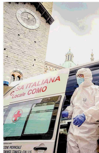
I numeri sul Lario continuano a crescere