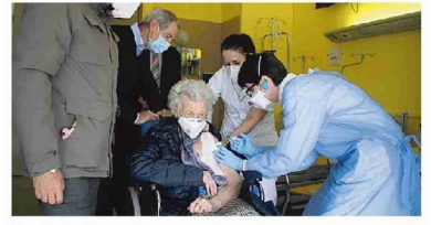
Vaccinazioni ancora in corso per gli over 80