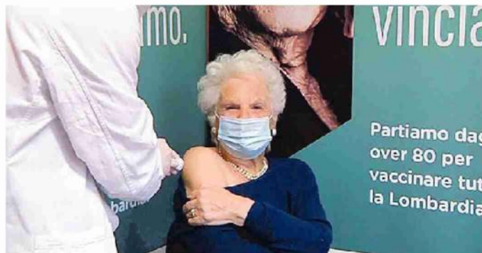
Liliana Segre si è vaccinata ieri all'ospedale Fatebenefratelli di Milano

Intanto i Nas fanno visita nella sede della regione Veneto, su incarico dei magistrati, per accertare chi siano gli intermediari che propongono il vaccino Pfizer al di fuori degli accordi stabiliti dall'azienda con la Commissione Ue. «Si tratterebbe di due russi», riferisce un'autorevole fonte del ministero della salute. «Ma visto che l'azienda ha categoricamente escluso la vendita nel libero mercato - spiega - delle due l'una: o si tratta di un tentativo di raggirio, oppure di dosi acquistate non si sa come da paesi poveri e rivendute con sovrapprezzo a quelli ricchi». Che sarebbe forse ancora peggio. —