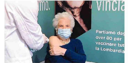
Liliana Segre si è vaccinata ieri all'ospedale Fatebenefratelli di Milano