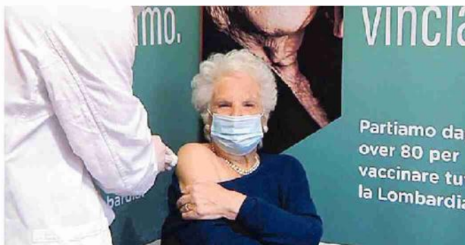
Liliana Segre si è vaccinata ieri all'ospedale Fatebenefratelli di Milano

Intanto i Nas fanno visita nella sede della regione Veneto, su incarico dei magistrati, per accertare chi siano gli intermediari che propongono il vaccino Pfizer al di fuori degli accordi stabiliti dall'azienda con la Commissione Ue. «Si tratterebbe di due russi», riferisce un'autorevole fonte del ministero della salute. «Ma visto che l'azienda ha categoricamente escluso la vendita nel libero mercato - spiega - delle due l'una: o si tratta di un tentativo di aggiramento, oppure di dosi acquistate non si sa come da paesi poveri e rivendute con sovrapprezzo a quelli ricchi». Che sarebbe forse ancora peggio. —