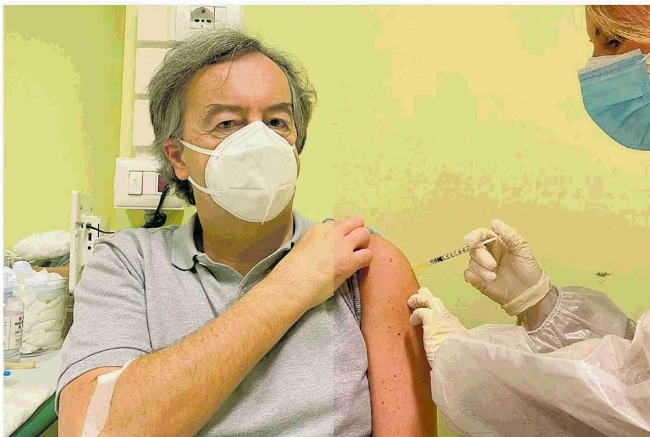
Roberto Burioni: «Vaccinarsi oggi è miracolo della scienza»

Il nostro obiettivo è quello di vaccinare tutti gli italiani che lo vorranno entro il prossimo autunno