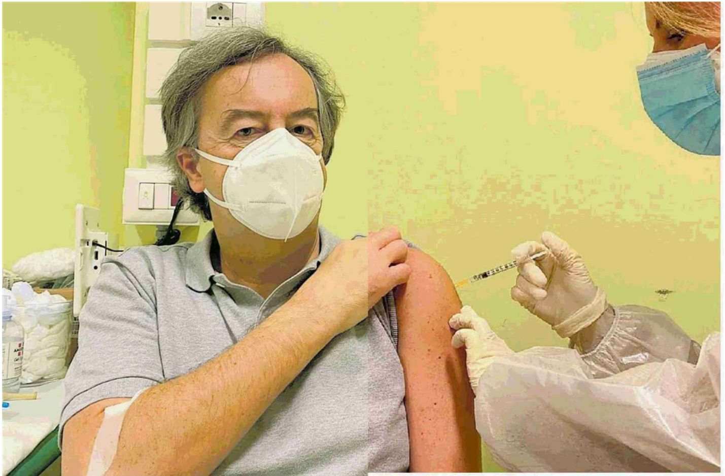
Roberto Burioni: «Vaccinarsi oggi è miracolo della scienza»