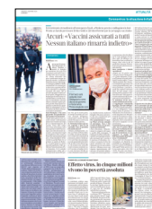
Peso: 6-26%, 7-9%