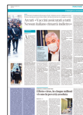
Peso: 2-26%, 3-9%