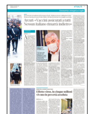
Peso: 8-27%, 9-9%