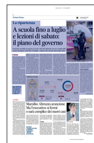
Peso: 1-10%, 2-57%

rantene e sanificazioni mentre altri, tra gli istituti superiori, hanno dovuto adottare le lezioni da 45 minuti per garantire la turnazione dei docenti riducendo comunque la presenza. Un ca-