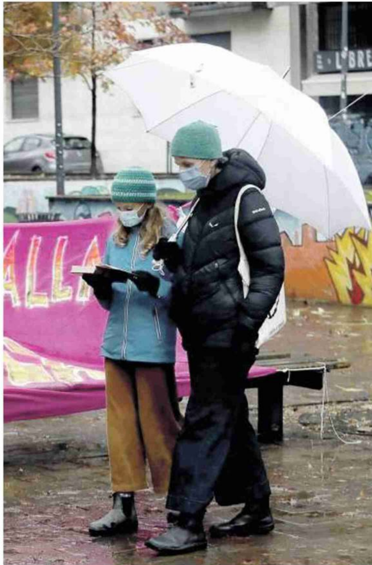
Lezioni nei giardini di via Cesariano a Milano