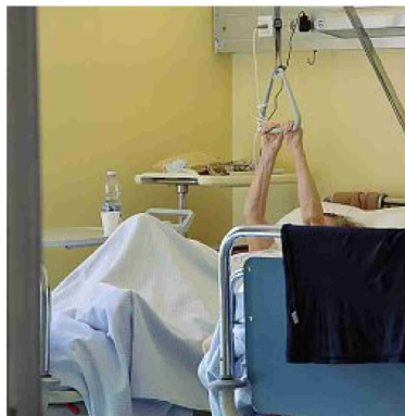
Anziani Un focolaio nella casa di riposo di Nave

● Cresce la pressione sugli ospedali a caccia di nuovi posti letto per pazienti positivi