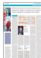
Peso: 6-42%, 7-4%

L'obiettivo è ampliare la disponibilità di posti letto in terapia intensiva: fino agli 8.732 letti promessi con il decreto Rilancio di aprile: prima della pandemia c'erano 5.179 posti. Altri 1.350 sono stati aggiunti negli ultimi mesi, in tutto 6.529. Ma a ostacolare lo sviluppo è la penuria di personale. I pensionati, richiamati in diverse zone d'Italia, nicchiano. La tempesta soffia forte. –