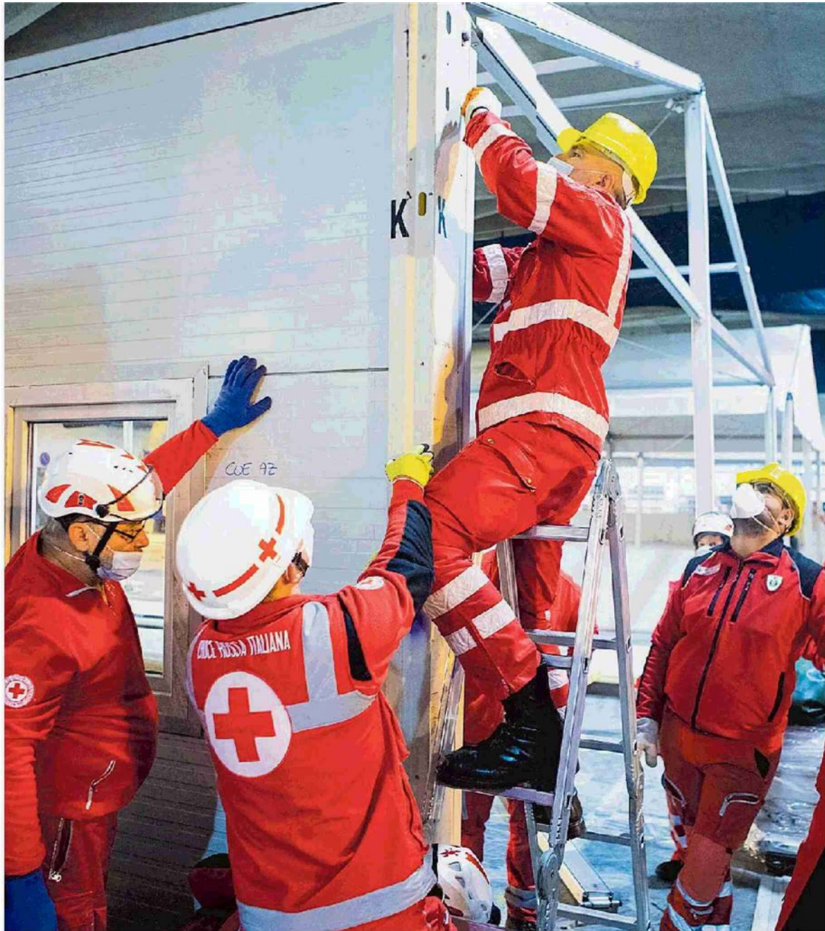
Allestimento di un centro Covid a Torino al Parco del Valentino