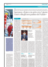
Peso: 2-42%, 3-4%

L'obiettivo è ampliare la disponibilità di posti letto in terapia intensiva: fino agli 8.732 letti promessi con il decreto Rilancio di aprile: prima della pandemia c'erano 5.179 posti. Altri 1.350 sono stati aggiunti negli ultimi mesi, in tutto 6.529. Ma a ostacolare lo sviluppo è la penuria di personale. I pensionati, richiamati in diverse zone d'Italia, nicchiano. La tempesta soffia forte. –