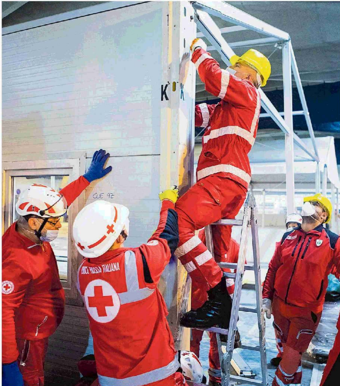
Allestimento di un centro Covid a Torino al Parco del Valentino