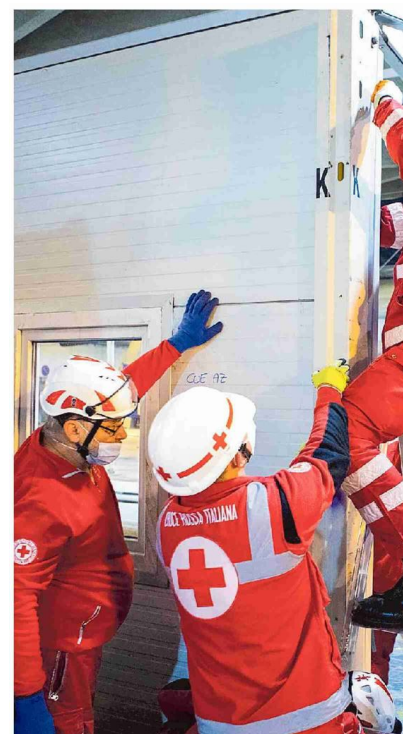
Allestimento di un centro Covid a Torino al Parco del Valentino