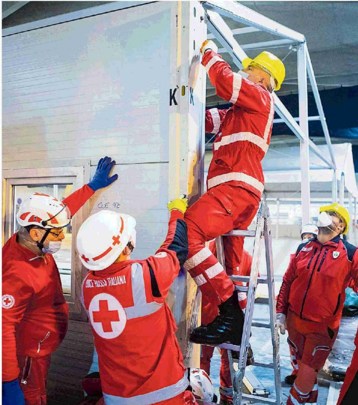
Allestimento di un centro Covid a Torino al Parco del Valentino