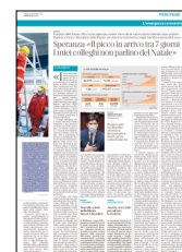
Peso: 2-42%, 3-4%

L'obiettivo è ampliare la disponibilità di posti letto in terapia intensiva: fino agli 8.732 letti promessi con il decreto Rilancio di aprile: prima della pandemia c'erano 5.179 posti. Altri 1.350 sono stati aggiunti negli ultimi mesi, in tutto 6.529. Ma a ostacolare lo sviluppo è la penuria di personale. I pensionati, richiamati in diverse zone d'Italia, nicchiano. La tempesta soffia forte. –