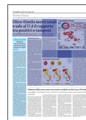
Peso: 1-2%, 2-53%

C'è stata una decrescita dell'accelerazione della diffusione del virus ma «la riduzione è ancora blanda e servono ancora 3/4 giorni per avere la conferma dell'andamento del trend», spiega anche Amerigo Cichetti, direttore di Altems, Alta Scuola di Economia e Management dei Sistemi Sanitari dell'Università Cattolica di Roma, che ogni settimana realizza un'analisi sui principali parametri di analisi della situazione Covid in Italia. «Resterei prudente per vedere se questo trend resta stabile» suggerisce, indicando un valore che potrebbe influenzare l'analisi. Per Cichetti infatti non si può considerare il numero dei contagi unicamente rispetto al numero dei tamponi, che si dividono in tamponi di screening (cioè il primo tampone al quale ci si sottopone perché si è sintomatici o perché si è venuti a contatto con un positivo) e i tamponi confermativi. Fino a quando staremo appresso a questo valore, a parere dell'esperto, il quadro potrebbe non essere rappresentativo, e per questo Cichetti invita a considera-