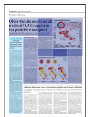
Peso: 1-2%, 2-53%

Il presente documento è ad uso esclusivo del committente.