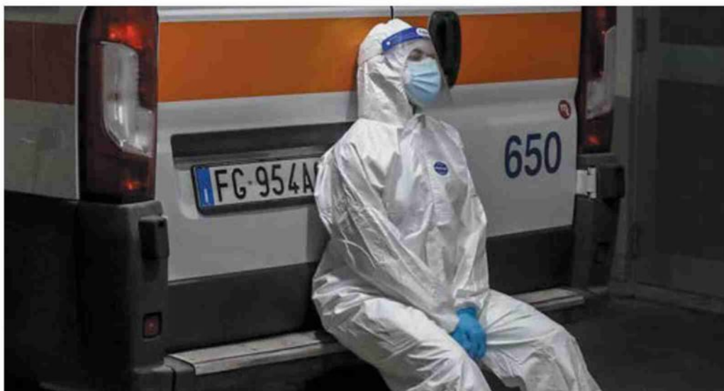
Il riposo momentaneo di un sanitario