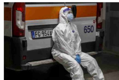
Il momento di riposo di un sanitario