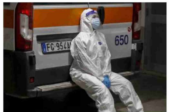
Il momento di riposo di un sanitario