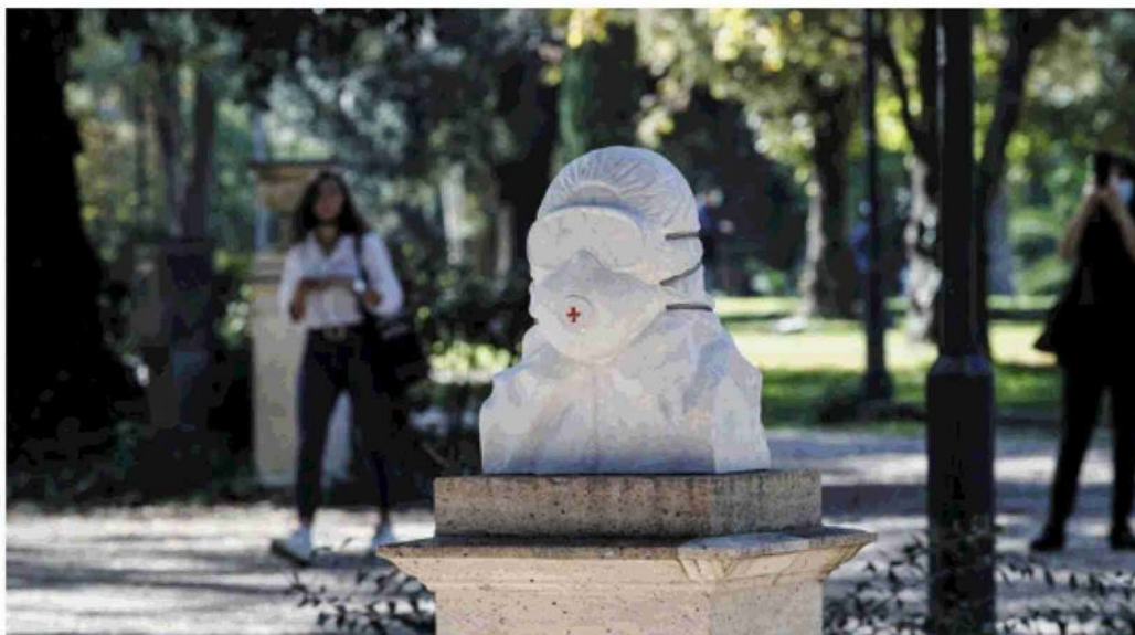
Un busto dedicato ai medici installato al Pincio, a Roma