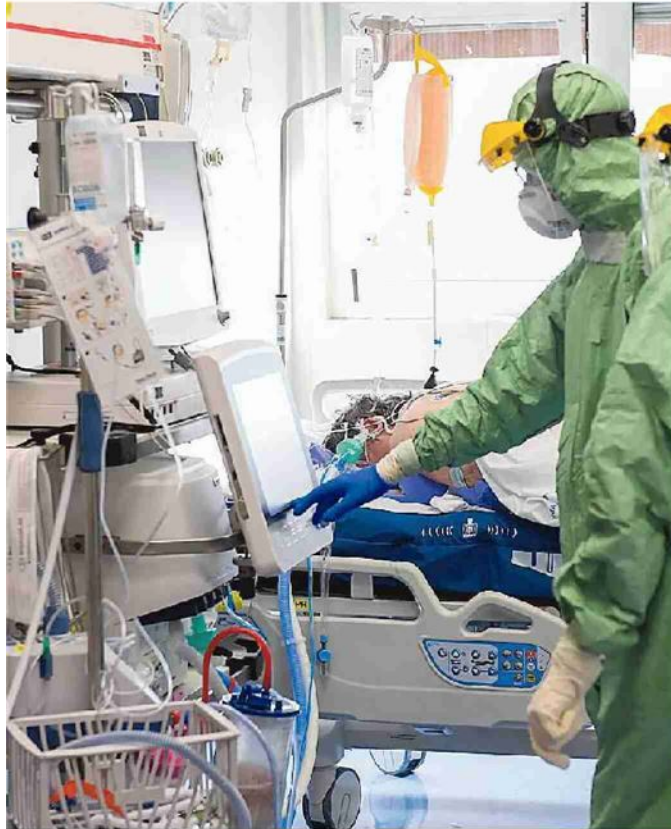
Il reparto di Terapia intensiva di un ospedale a Reggio Calabria