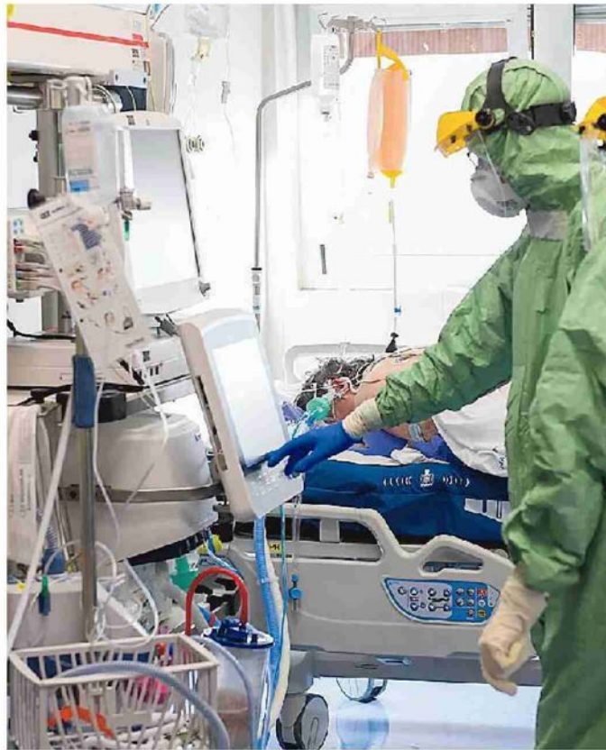
Il reparto di Terapia intensiva di un ospedale a Reggio Calabria