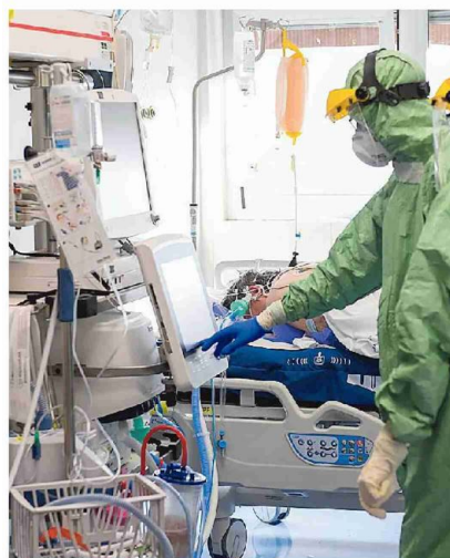
Il reparto di Terapia intensiva di un ospedale a Reggio Calabria

Bisognava gestire meglio l'epidemia anche perché adesso non ci aspetta il periodo estivo come a marzo e aprile