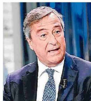
NINO CARTABELLOTTA MEDICO E PRESIDENTE DELLA FONDAZIONE GIMBE DI BOLOGNA

Bisognava gestire meglio l'epidemia anche perché adesso non ci aspetta il periodo estivo come a marzo e aprile