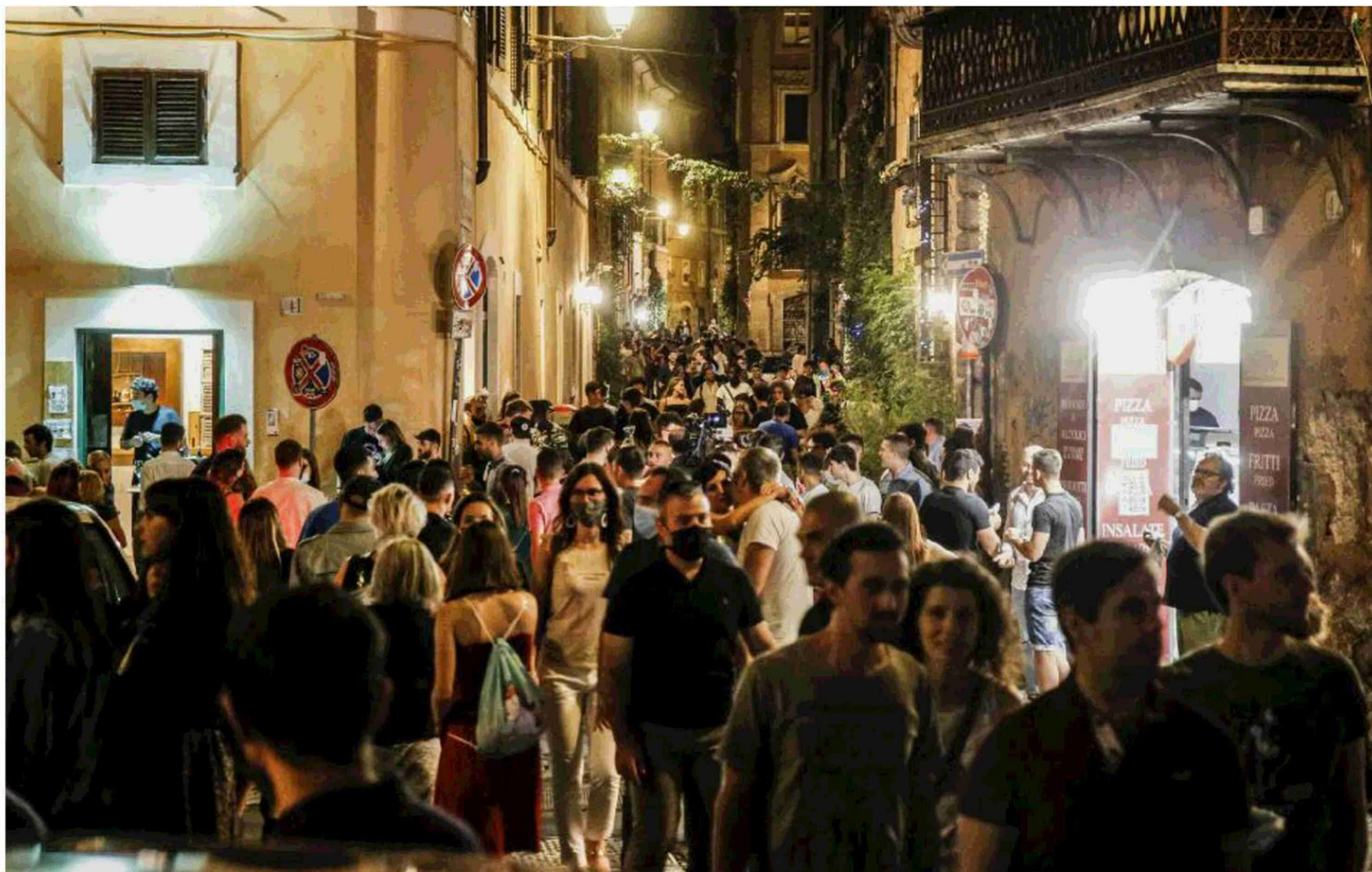
La vita notturna tra piazza Trilussa e vicolo del Moro a Trastevere