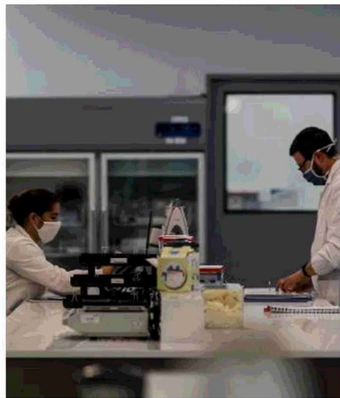
Un laboratorio di ricerca per la produzione del vaccino anti-covid